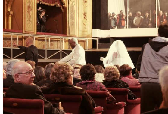
Hagen führt Gunther und Brünnhilde zu den Gibichungen