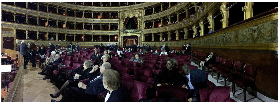
Vor Beginn der Aufführung: Das Teatro Massimo füllt sich

Ende Januar fand im Teatro Massimo, der prächtigen Oper von Palermo, die „Inaugurazione“, die feierliche Eröffnung der Opernsaison 2016, mit der Premiere der Götterdämmerung von Richard Wagner als Schlussstein des im Jahre 2013 begonnenen Ring-Projekts statt. Der Richard-Wagner-Verband Düsseldorf ließ es sich nicht nehmen, im Vorgriff auf die Städtepartnerschaft zwischen Palermo und Düsseldorf dem Teatro Massimo seine Aufwartung zu machen und ist mit 25 Mitgliedern und Wagner-Freunden nach Palermo gereist, um diese erwartbar spektakuläre Inszenierung des Engländers Graham Vick zu sehen. Diese Erwartung wurde nicht enttäuscht.