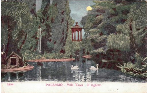
Villa Tasca Park, alte Postkarte

während ihres Aufenthaltes in Palermo wohnte. Wir besuchten die Sehenswürdigkeiten, die Richard Wagner und Cosima in Palermo und Umgebung laut Cosimas Tagebuch während ihres fast 5 monatigen Aufenthaltes in Palermo und Umgebung (Monreale, Cèfalu, Villa Palagonia in Bagheria) auch gesehen hatten.