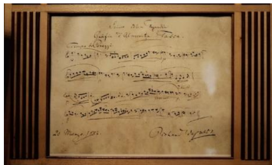
Das „Porazzi“-Thema im Salon der Tascas

Im Salon der Villa Tasca ist auf dem Flügel das Original des berühmten „Porazzi“-Themas zu sehen, das Richard Wagner in Palermo geschrieben und dem Grafen Tasca zum Geschenk gemacht hatte.