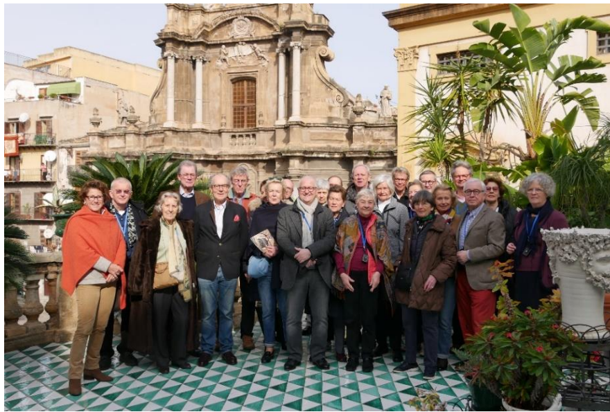
Auf der Terrasse des Palazzo Gangi-Valguenera